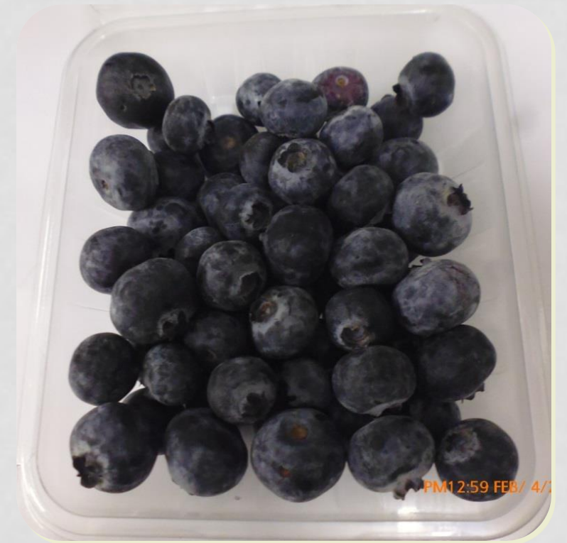
Muestra con bolsa