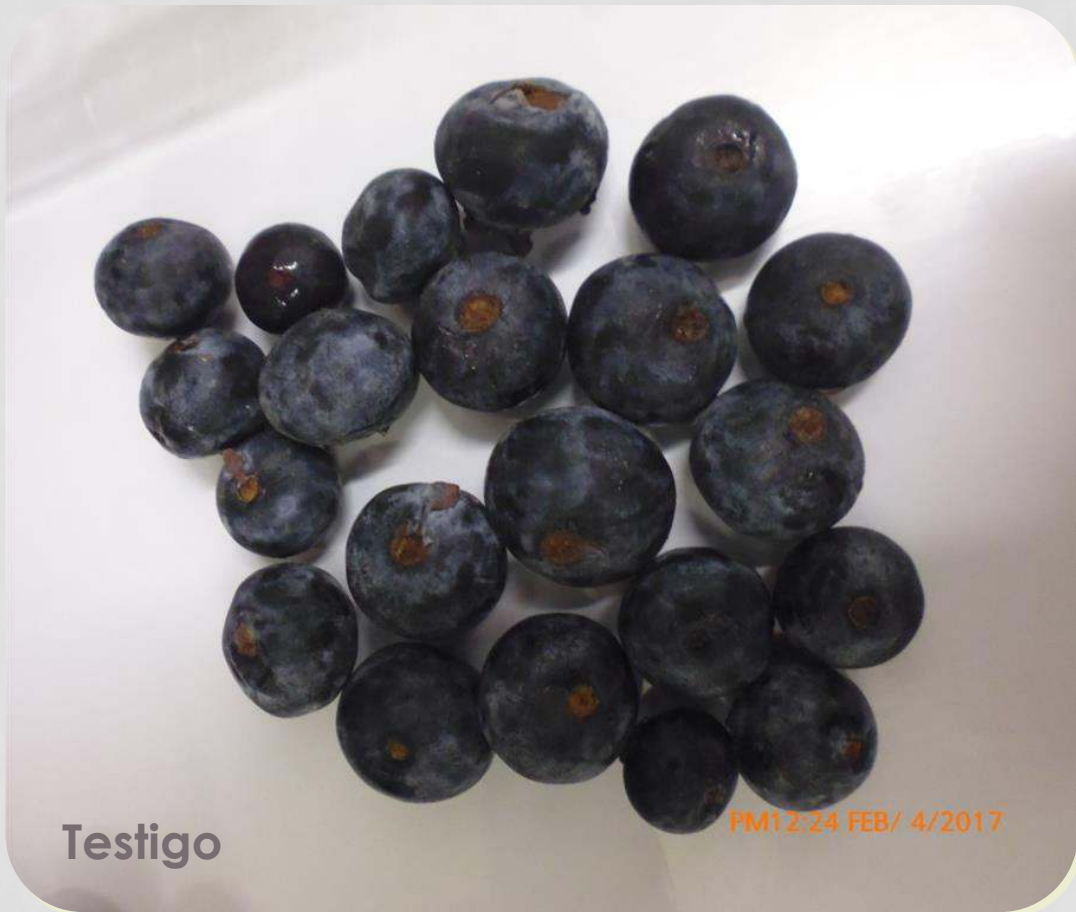
Testigo PM12:24 FEB/ 4/2017