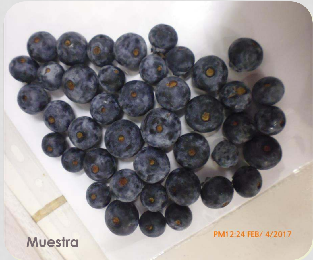
Muestra PM12:24 FEB/ 4/2017