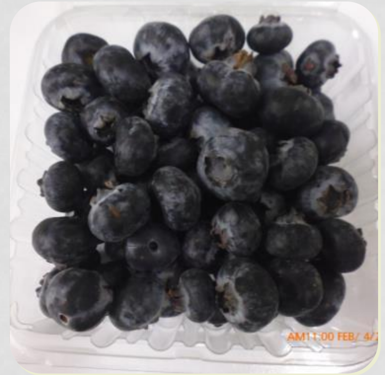
Muestra con bolsa