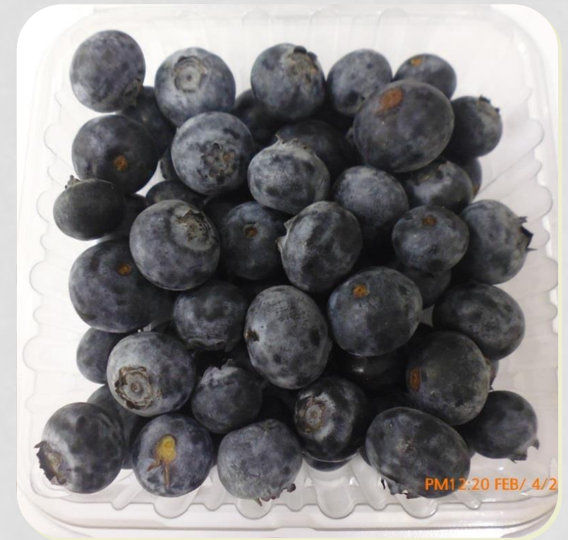
Muestra con bolsa