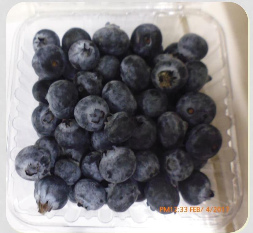
Muestra con bolsa